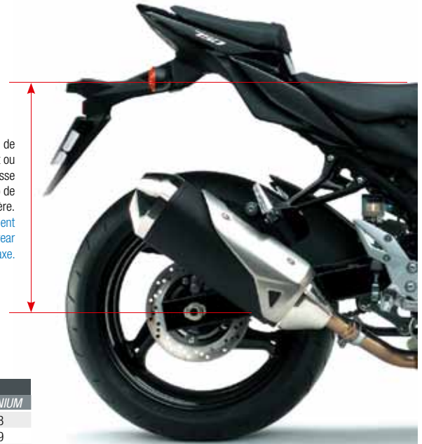
Mesure de l'abaissement ou de la réhausse à l'aplomb de la roue arrière. Height adjustment from the rear wheel axle.