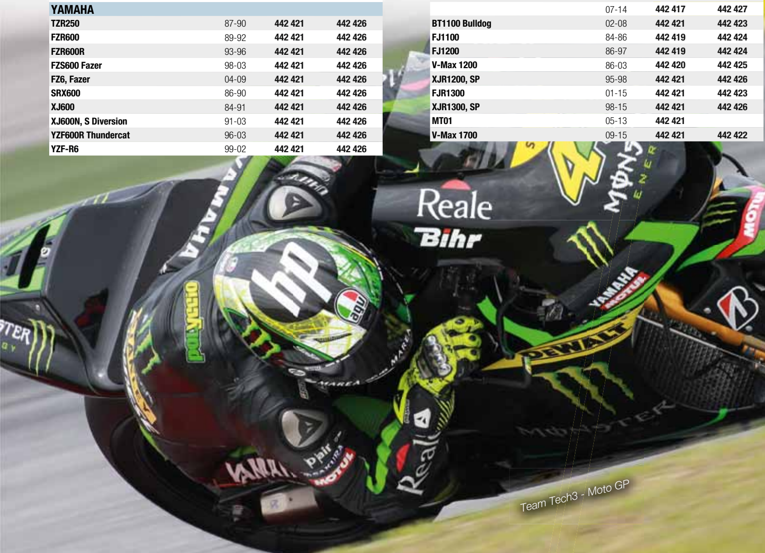
Team Tech3 - Moto GP